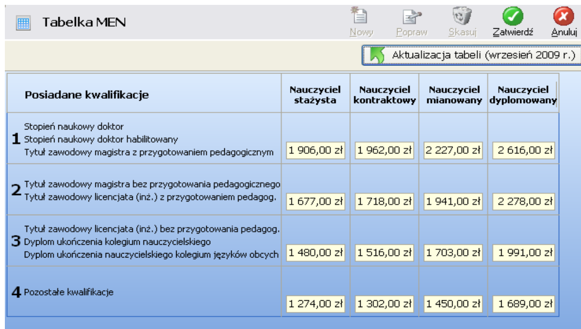
Rysunek 1. Okno przedstawiające tabelkę MEN.

Program PŁACE wyznacza wynagrodzenie zasadnicze dla nauczycieli na podstawie Tabeli MEN, która mieści się w opcji <Ustawienia> <Parametry> <Tabela MEN>.