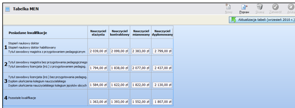
Rysunek 1. Okno przedstawiające tabelę MEN.

Program KADRY i PŁACE wyznacza wynagrodzenie zasadnicze dla nauczycieli na podstawie Tabeli MEN, która mieści się w opcji <Ustawienia> <Parametry> <Tabela MEN>.